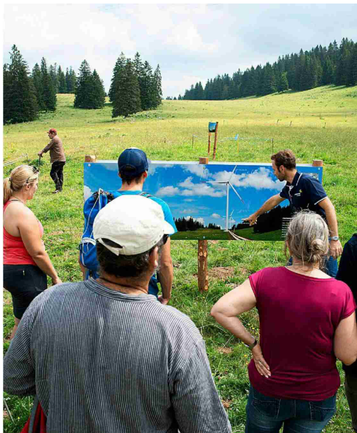
En 2018, des photomontages avaient été installés dans les pâturages de la Grandsonnaz pour montrer l'implantation des éoliennes.